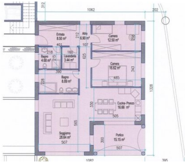
Grundriss App. 5